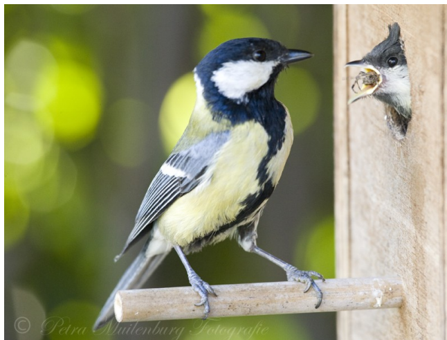
Gespiegeld landschap ~ Loetbos

Laat je vooral niet ontmoedigen, want onvergetelijke foto's liggen in het verschiet!