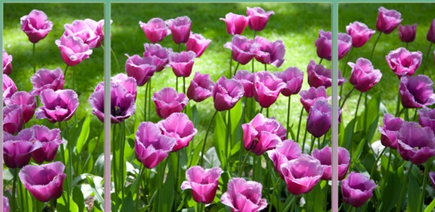
Tulpen drieluik

Telefoon: (010) 220 34 65 E-mail: info@capelle- fotografeert.nl